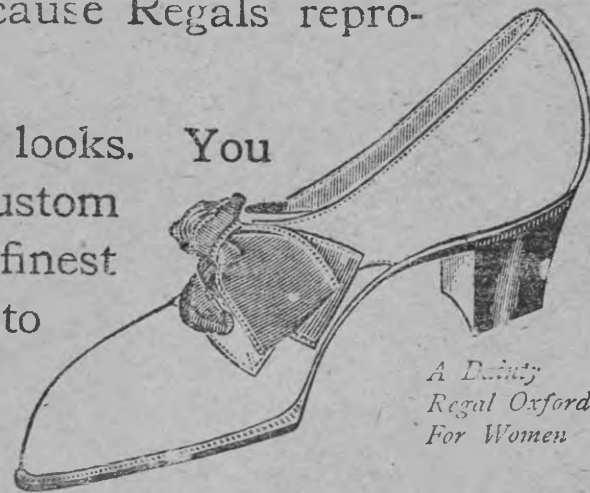
A Dainty Regal Oxford For Women